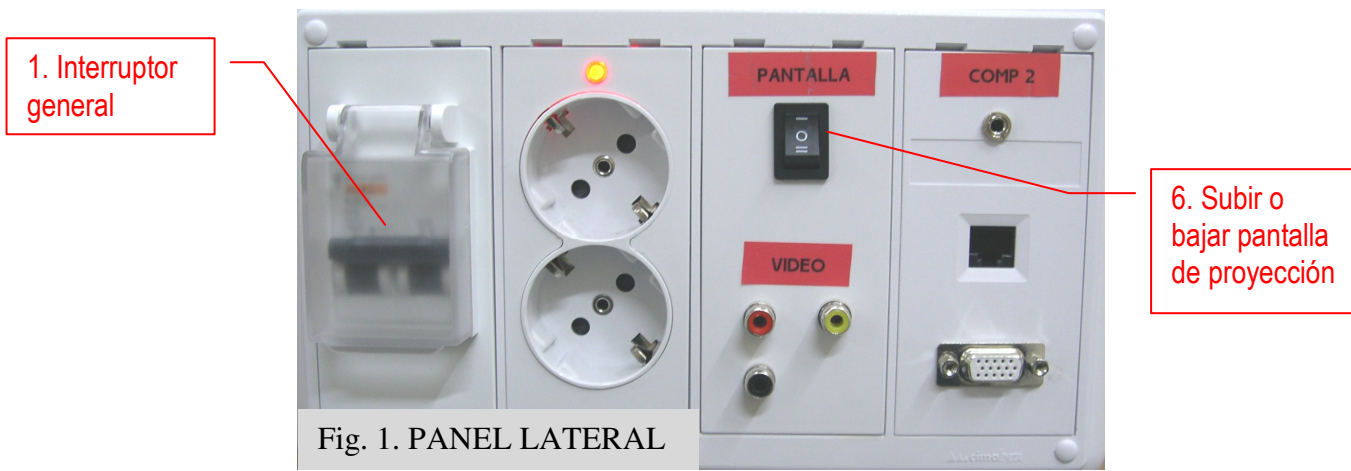
Fig. 1. PANEL LATERAL