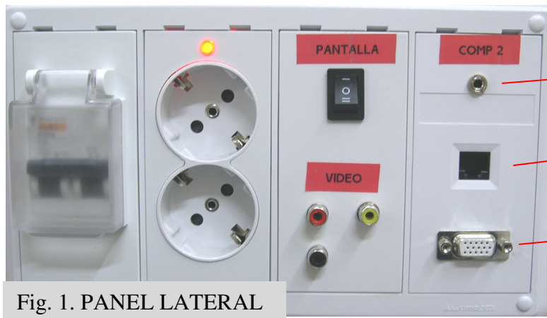
Fig. 1. PANEL LATERAL